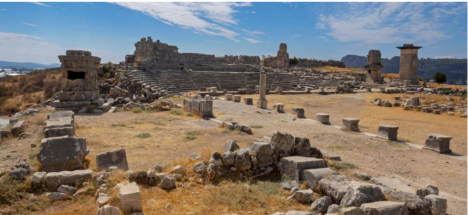
Xanthos Antik Kenti'nin Kalıntıları, Türkiye

Kültürel olarak, diğer birçok alanda olduğu gibi, Türkiye, eşsiz karışımını üretmek için her ikisinden de unsurlar alarak Doğu ve Batı arasında yer almaktadır. Şimdi cumhuriyeti oluşturan bölge, klasik Avrupa medeniyetlerinden ve İslami Ortadoğu'dan gelen zengin bir kültürel mirasla çarpıcı bir dizi kültürel etkiye maruz kalmıştır. Örneğin İstanbul çevresindeki tarihi alanlar, eski Hitit başkenti Hattuşa, Divriği Camii ve Darüşşifası, Nemrut Dağı'ndaki harabeler, Safranbolu kenti Xanthos-Letoon ve Truva ören yeri zengin kültürel miras örnekleridir.