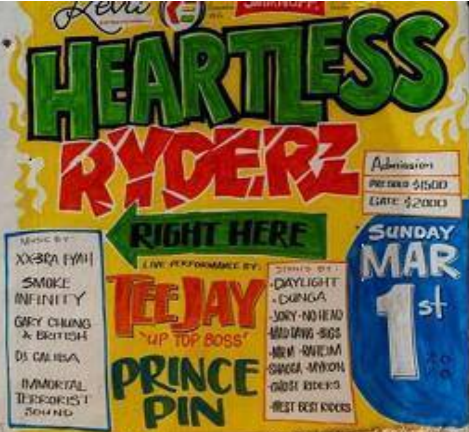
Jamaican Handpainted Signs

Jamaican Dance Hall tabelalarındaki (5) kısa koşu fanzinlerinden birini satın alarak 8 £ gibi düşük bir fiyata Tracey Thorne'un bir parçasına sahip olabilirsiniz. Veya Hockley, Birmingham'daki Soho Hill'deki New Palladium için bir hayalet tabelasının üç Tek Renkli ekran baskısından birini 350 £ karşılığında duvarınıza asabilirsiniz, hatta sanatçı tarafından imzalanmış (6). Web sitesinde açık ve erişilebilir bir "dükkan"da sunuldu, çünkü Tracey ayda birkaç birim bile değiştiriyor ve matematik anlam kazanmaya başlıyor.