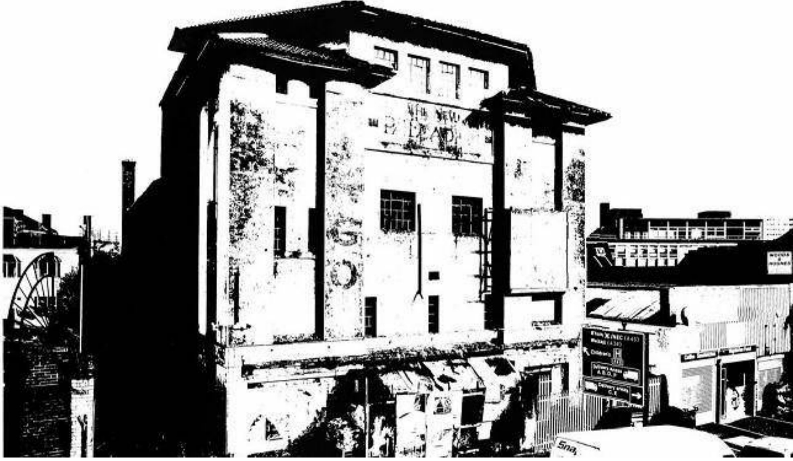
Ghost Signs, Birmingham

Yine de, haftalık bültenleri için şehrin fotoğraflarını çekmesi istendiğinde, Tracey'nin CIC'si Ghost Streets'in başlık projesini doğuran Birmingham Conservation Trust (BCT) için bir sevgi emeği olurdu. Haftada bir fotoğraf olarak başlayan şey, Tracey'i dünyanın öbür ucuna götüren uzun soluklu bir belgesel projesine dönüştü.