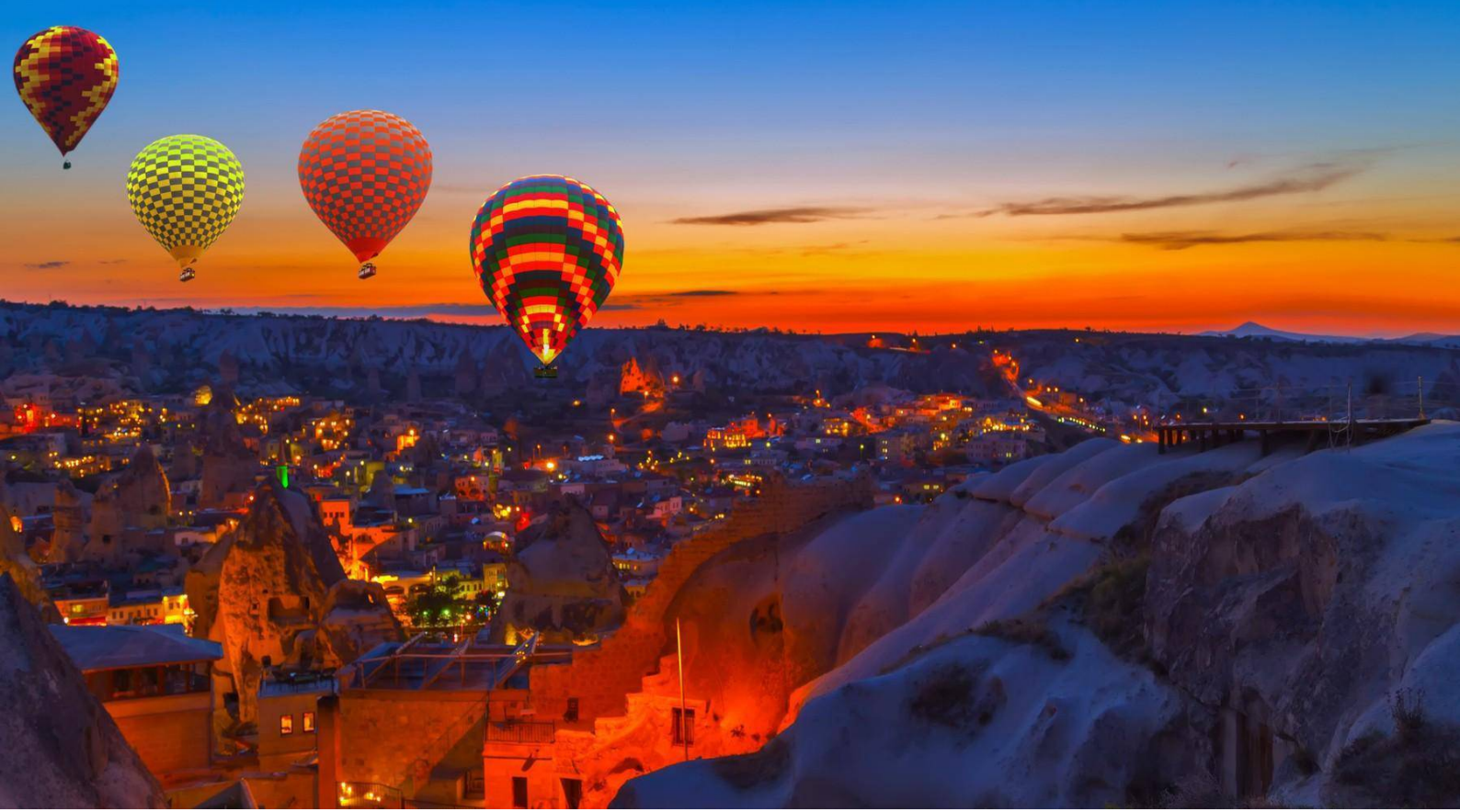
Göreme Milli Parkı'nda hava balonu , Kapadokya

Bunların yanı sıra UNESCO Türkiye'de iki ilginç özelliği bulunan Göreme Milli Parkı bölgesi ve dramatik yapısı ve Bizans sanatının izleriyle tanınan Kapadokya Kayalık Alanları, Türkiye'nin eşsiz kültürel mirasları arasında yer almaktadır. Kayalık manzarası, eşsiz mineral oluşumları ve taşlaşmış şelalelerin teraslı havzaları ile tanınan Hierapolis-Pamukkale, M.Ö. 2. yüzyılda burada inşa edilen termal banyo ve tapınak kalıntılarıyla Türkiye'nin kültürel zenginliğinin bir örneğidir.