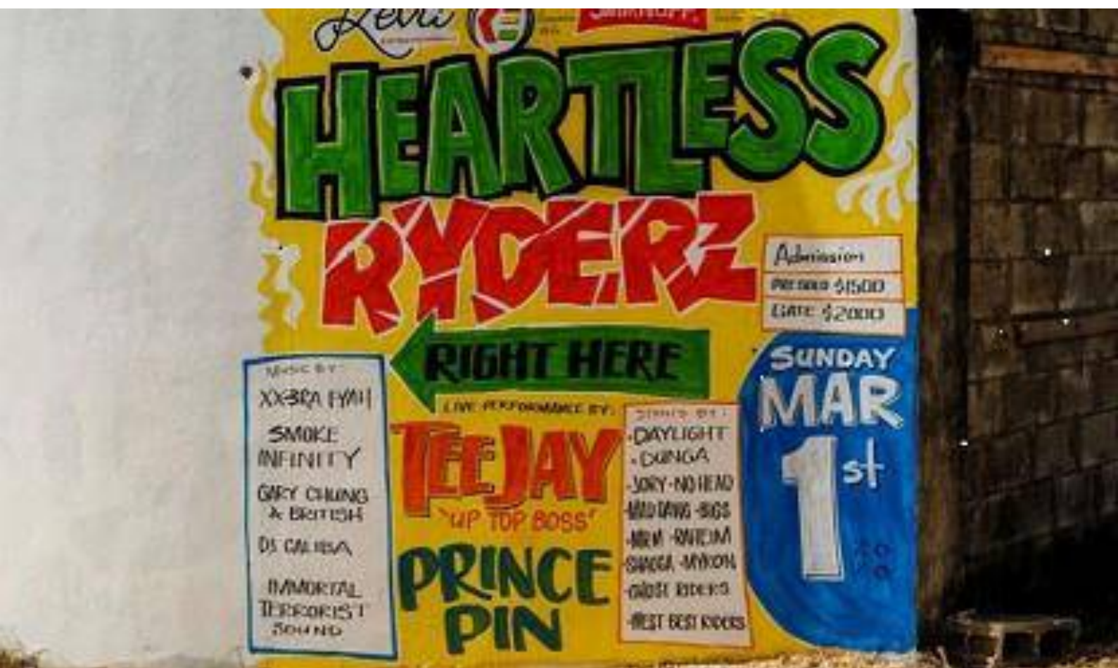
Sinalética Jamaicana Pintada à Mão

Pode adquirir uma peça de Tracey Thorne a partir de apenas £8, comprando um dos seus fanzines de edição limitada sobre sinalética Dance Hall da Jamaica (5). Ou pode pendurar na sua parede uma das três serigrafias monocromáticas de uma sinalética antiga para o New Palladium em Soho Hill em Hockley, Birmingham, por £350, assinada pela artista (6). Todos estes produtos encontram-se disponíveis numa 'loja' online no seu website.