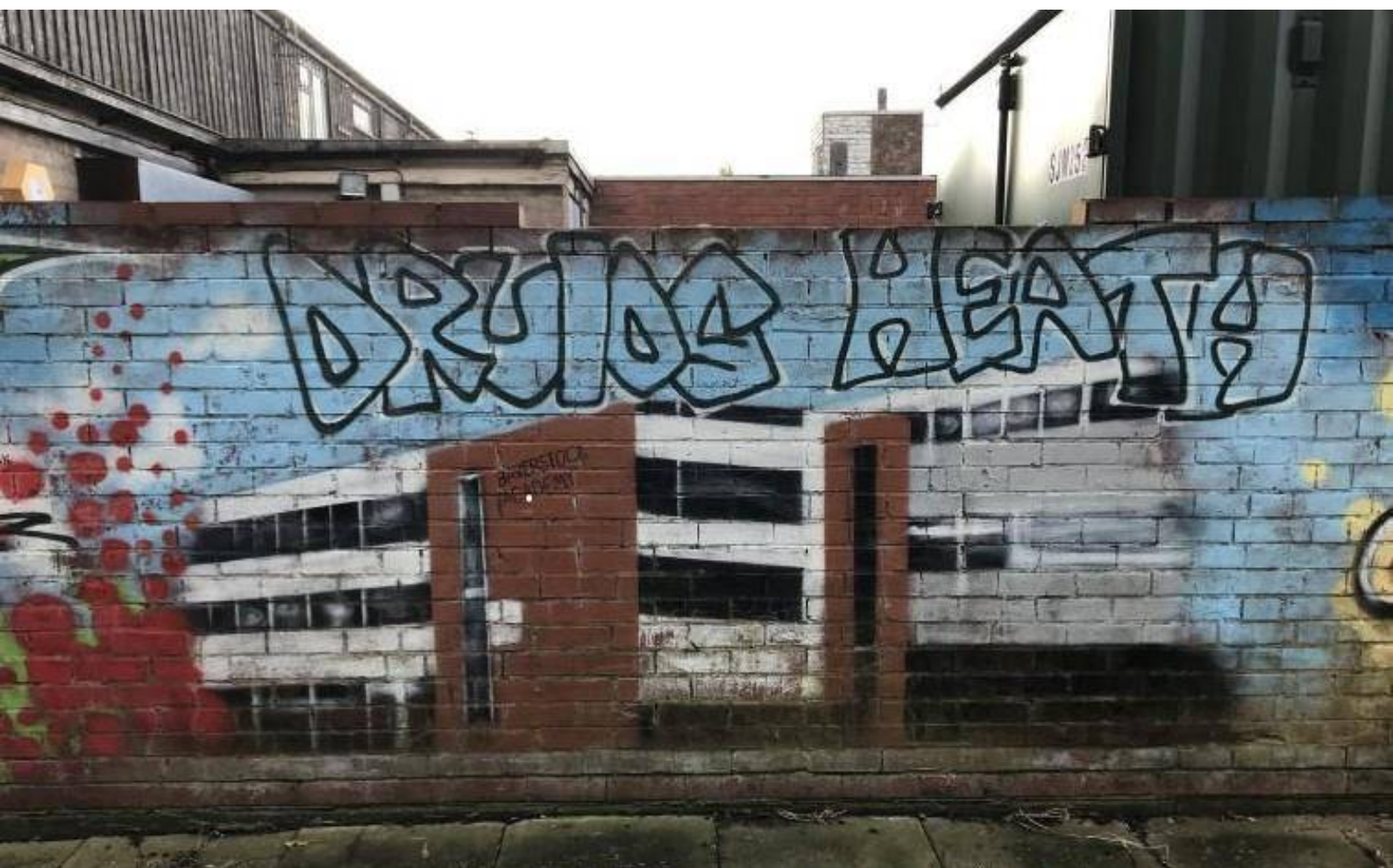
Graffiti, Druids Heath