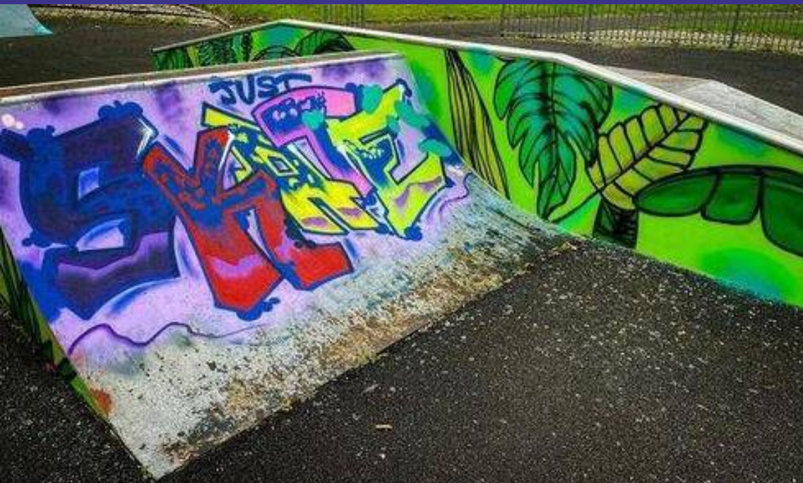
Parque de Skate , GeorgesPark Localizado no centro de Georges Park, este é um parque de skate onde nos sentimos seguros, podemos patinar, brincar e desfrutar.