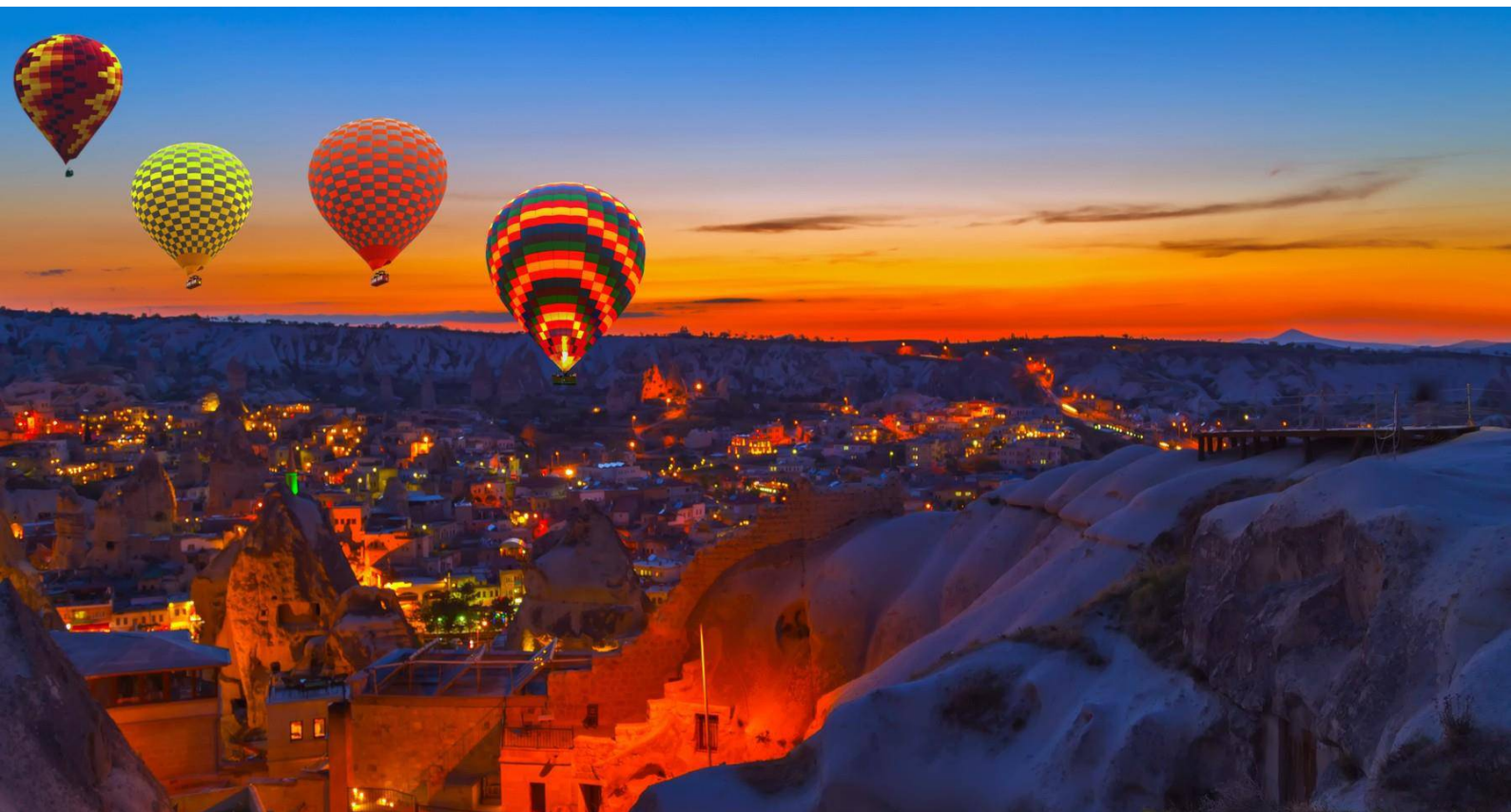
Balões de ar quente ao nascer do sol, no Parque Nacional de Goreme, Capadócia

Para além destas heranças, a região do Parque Nacional de Göreme, tem duas características interessantes e únicas no que diz respeito ao património na Turquia. São as suas formações rochosas na Capadócia, conhecidas pela sua estrutura dramática e os traços da arte bizantina. O património Mundial da UNESCO na Turquia é conhecido pela sua paisagem rochosa e pelas suas bacias de formações minerais únicas e as suas cachoeiras petrificadas, Hierapolis-Pamukkale é um exemplo da riqueza cultural da Turquia, com o banho termal e as ruínas dos templos construídos aqui no século II a.C..