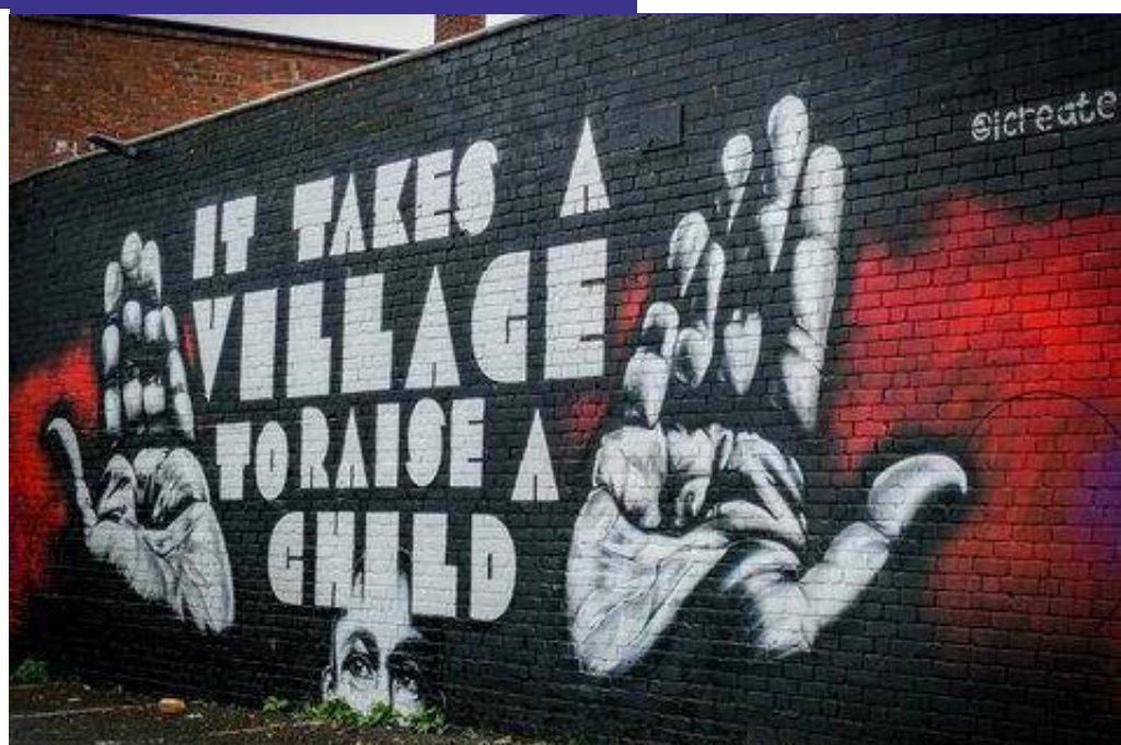
Criar uma criança, 1 George St "O provérbio africano 'É preciso uma aldeia para criar uma criança' pretende espelhar a própria natureza de Lozells e da comunidade que vive dentro dela".